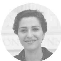
Sarah El HAÏRY Secrétaire d'État auprès du ministre de l'Éducation nationale, de la Jeunesse et des Sports, en charge de la jeunesse et de l'engagement

Je voudrais profiter de ces quelques lignes pour adresser un message clair : vous n'êtes pas le produit de votre handicap. Vous êtes ; point final. Partout où la jeunesse se mobilise pour un monde meilleur, elle nous trouvera à ses côtés. Soyez-sûrs que je le serais avec la fédération 100 % Handinamique ! Joyeux anniversaire.