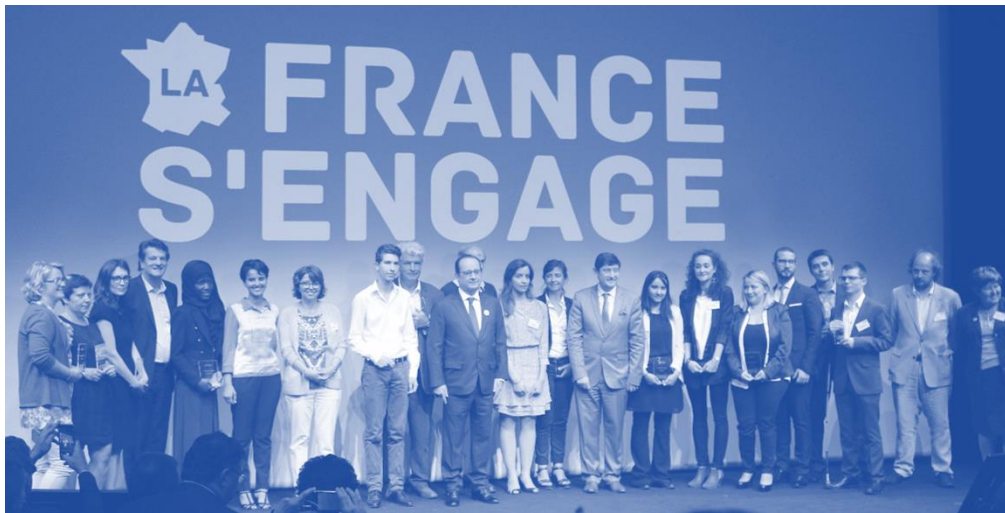
22 juin 2015 : la FÉDÉEHandicap lauréate de l'initiative présidentielle « La France s'engage »