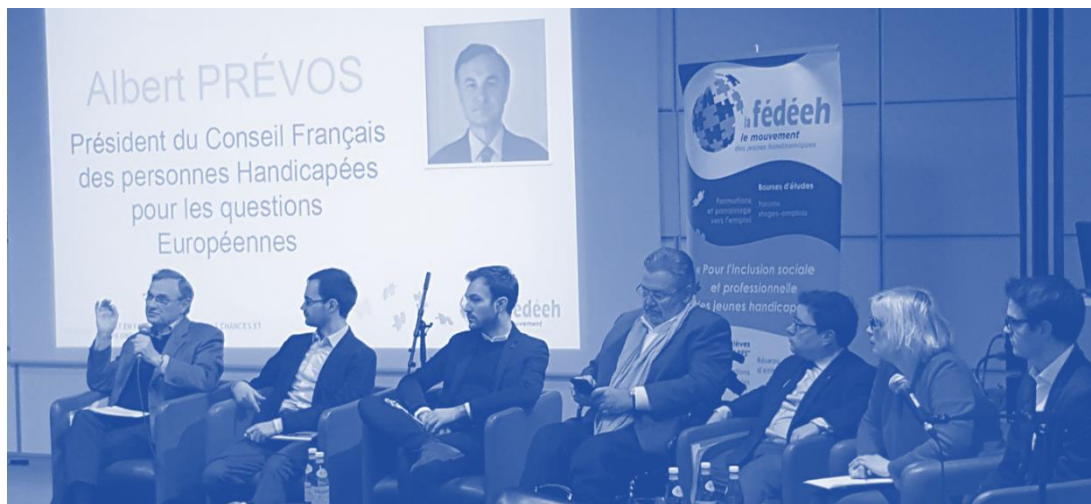
7 mars 2017 : débat public avec les 4 conseillers handicapés des principaux candidats à la présidentielle.