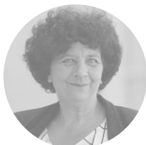
Frédérique VIDAL Ministre de l'Enseignement supérieur, de la Recherche et de l'innovation

Je souhaite un excellent anniversaire à la fédé 100 % Handinamique et plein de succès dans ses futurs projets !