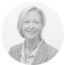
Sophie CLUZEL Secrétaire d'État auprès du Premier ministre en charge des personnes handicapées

C'est confiante dans votre capacité à rester une précieuse source d'inspiration pour que la société française reflète toujours davantage les attendus de la Convention internationale du droit des personnes handicapées, ratifiée l'année de votre création, que j'adresse à la fédé 100 % Handinamique tous mes vœux de succès pour la décennie à venir et vous souhaite très chaleureusement un joyeux anniversaire.