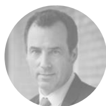
Laurent CHAMPANEY Président de la Conférence des grandes écoles

Ensemble, continuons d'œuvrer en faveur d'une plus grande équité et d'une plus grande accessibilité des jeunes en situation de handicap dans l'enseignement supérieur. Vous pouvez compter sur la mobilisation des Grandes écoles pour poursuivre la dynamique inclusive engagée à vos côtés !